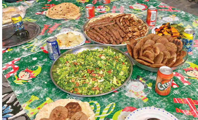
與老友記，移民和難民背景的家庭同行，分享福音

除了與我聯繫之外，可以為我們禱告和奉獻。我可以向當地教會提出一些建議去服侍他們社區的低收入家庭。我們將為他們提供研討會和聖經學習，建立好參與的根基，我們不希望教會只是來參觀或作短暫參與，我們不是示範中心，這樣做是會傷害社區的。任何社區都有低收入家庭和被邊緣化的人，溫市其他地方也需要我們成為耶穌的手和腳。大家可以透過不同的服侍對象去接觸未得贖之民，例如與穆斯林社群聯繫，展示我們的信仰和愛。事實上，我們的愛心服侍與生命見證是持續性的，不但以互助關係 (mutual relationships) 將心擺上，務求能與服侍的對象建立長遠的關係，更重要的是帶著上帝的形象去服務社會。這些服侍的經歷與經驗，我們都可以與教會及主內肢體分享。