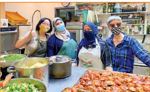
組織草根階層人士和栽培地區領袖，一起面對貧窮的挑戰