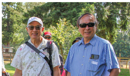
短宣董事參加同樂日

這是一首「上行之詩」。在大衛的年代，有一群人為了敬拜上帝，從不同的地方共同往耶路撒冷前進。到了晚上，大家共同住宿，因著都是與神聯合的上行之人，竟呈現出如此美好的「和睦同居」，引得詩人吟頌。神的子民快樂地生活在一起的美善，勝過膏祭司亞倫的貴重的油，那散發到四周的香氣，見證著神子民의 相交與聯合。「和睦同居」的美善又好比黑門山充沛的雨露降在錫安山，高山與低丘同得甘美滴露，每一個人都滿有從神而來的喜樂和生命。