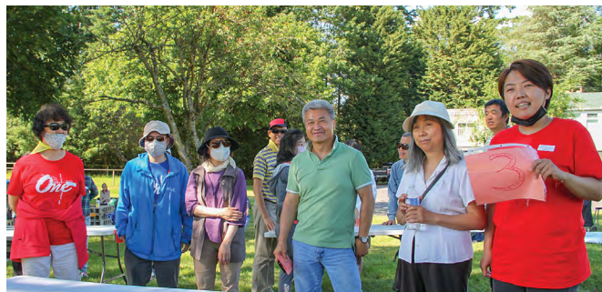
遊戲比賽我們也是認真