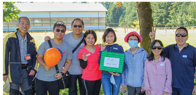
遊戲得勝後獲獎的喜悅