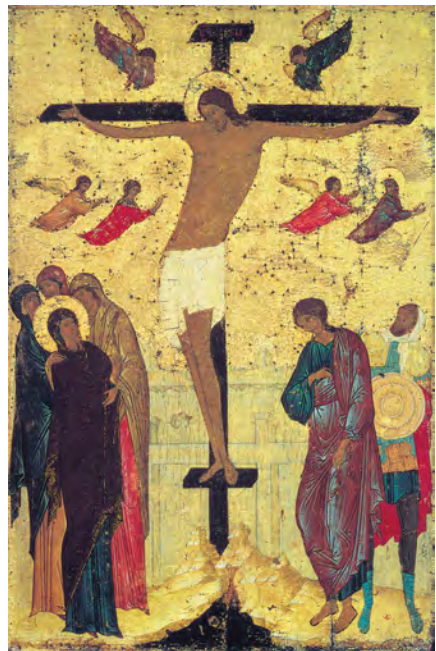
《釘十字架》，季奧尼斯，1500年

人像在聖像畫中佔據主要空間。人物的臉是最重要的，而身體則是隱藏的無關緊要部分。人物體型多是修長枯瘦，面部表情莊嚴肅穆。人物要畫成身體輕而靜止不動的樣子，微微低躬的身體表示服從上帝的意旨，以外在的脆弱表達內在的強大。聖像所描繪的不帶感情的人物臉部，以期讓人想起一系列的美德：純潔、忍耐、寬恕、憐憫和愛。十字架上的基督聖像，並未直接表現被釘十字架的基督所承受的肉體痛苦，而是著重表現祂走向十字架的真正內涵：為了我們而獻出自己生命的自願行為。(註2)