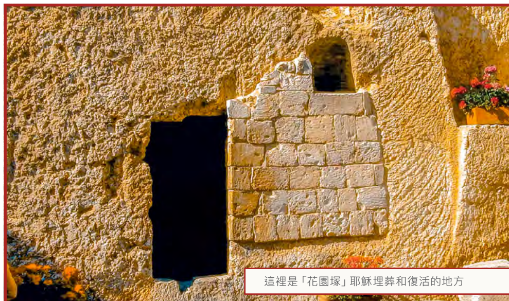
這裡是「花園塚」耶穌埋葬和復活的地方

我們的使命： 幫助您及您的家人，達到無負債及經濟獨立無憂。 投資 儲蓄 互惠 基金