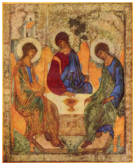
《聖三位一體》，安德列·魯布廖夫，1411年

其次，聖像被認為是用圖像和色彩表達出來的聖經經文和神學，通過象徵手段反映宗教的啟示。聖像畫中的一切都必須服從聖三位一體的基本思想。