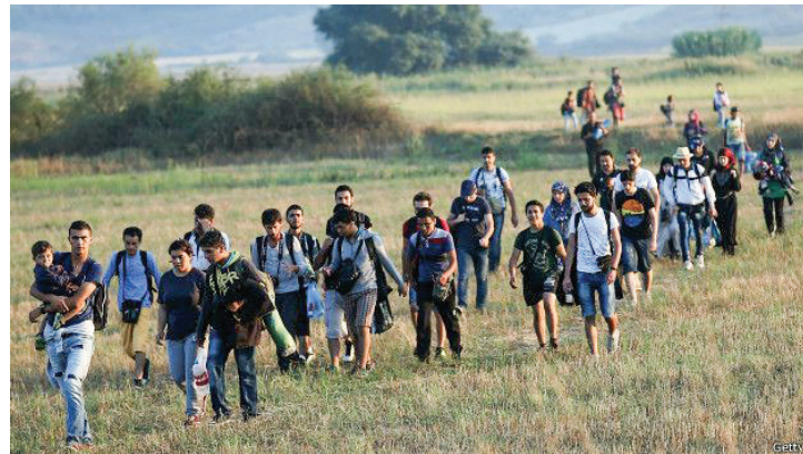
大批中東難民湧入歐洲(BBC)

願基督徒都記著這句話去關心所居住的國家：“以耶和華為神的，那國是有福的，祂所揀選為自己產業的，那民是有福的。” (詩篇 33:12)