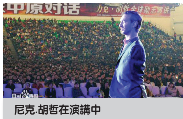
尼克·胡哲在演講中

這個生來沒有四肢，只有身軀和頭頸的水桶人，竟然有雙學位，計算機技術過人，全世界到處演講激勵人，告訴全世界人：“我很幸福，你們更能幸福！”原來幸福不是找來，而是發現。在他生來時，他的父母也曾傷心難過地詢問上帝：“為什麼給我這樣的孩子？”上帝告訴他父母：“他是上帝奇妙的創造”。父母的觀念改變了，歡然接受這個特殊兒，每當帶孩子外出，他們就以自豪的語言迎接他人異樣的眼光：“他是我的孩子，是上帝賜給我的禮物。”