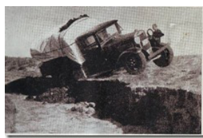
圖3-21 圖中遇險幾乎翻車入河 出自 Marshall Broomhall, To What Purpose?

告別了奧納博士，繼續西行。為了渡過納林河，他們將汽車的零件幾乎全部拆掉，讓七隻駱駝拉過河去，然後再重新組裝好。10月14日，進入新疆境內，天氣驟然寒冷起來。夜宿明水城的時候，氣溫竟然降至攝氏零下10度，以至於第二天要加熱汽車的水缸才能發動。終於抵達東疆的大城市哈密的時候，每輛汽車只剩下10加侖汽油！巴富義感嘆說：“主是供應之源，超過我們夢寐以求的期望。”